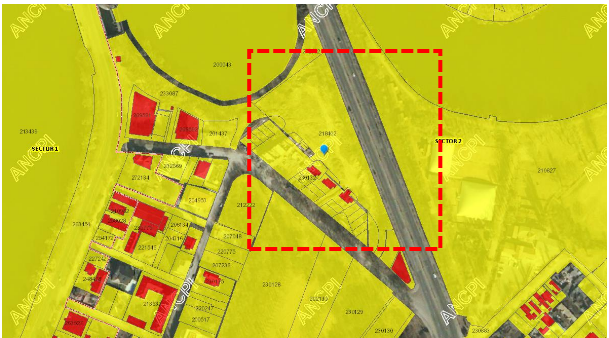
Extras din încadrare în ANCPI – Imobile Eterra

Avand in vedere cele prezentate mai sus, va aducem la cunostinta că se vor lua in calcul sugestiile dumneavoastra in adresa primita, iar reglementarile urbanistice finale se vor stabili în